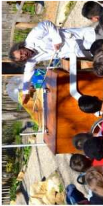
4. Le professeur Géopôle et sa carriole aménagée en laboratoire

D u nouveau au parc ludo-pédagogique du gouffre de Proumeyssac pour les vacances de printemps. Jusqu'au 8 mai, le site d'Audrix (24) accueille le professeur Géopôle.