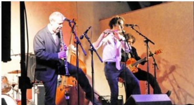
▲ L'ensemble Horse Raddish jouera sa musique klezmer dimanche 2 août au Bugue.

D epuis sa création en 1969 dans l'église romane d'Audrix, village du Périgord noir entre Vézère et Dordogne, les objectifs du festival Musique en Périgord n'ont pas varié : accueillir des artistes consacrés mais aussi de jeunes interprètes, faire connaître et aimer la musique en milieu rural, et familiariser les enfants avec différents types de musiques (1).